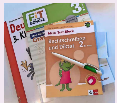
Nachhilfevermittlung für alle Lernstufen