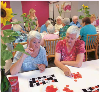
Lottomatch in Mels