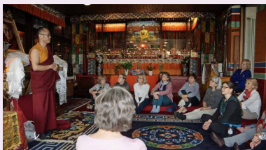
Sommertreff: Tibet-Kloster Rikon