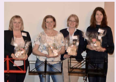
Neue FAGS Vorstandsfrauen