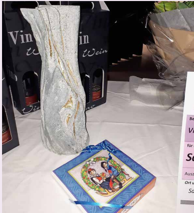
Prix FAGS 2019