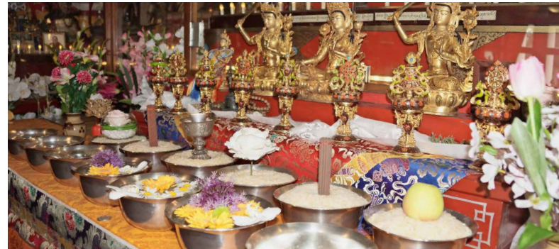
SIGA Ladies Day (links), Prix FAGS 2019 an Sportwoche Sarganserland-Werdenberg (oben rechts) und Tibet-Kloster (unten rechts)