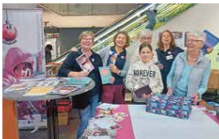
SIGA Ladies Day, REGA Kloten, HV FAGS 2023, Weihnachtspäckli-Aktion